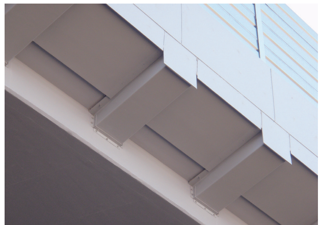
写真五 RC中空床版部路肩側のFRP型枠

RC中空床版橋は、張出し床版先端部の床版下面と壁高欄外側、および橋軸方向に2mピッチで設置するRC追