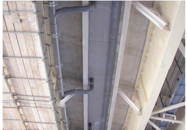
写真三 鋼桁部中央分離帯側のFRP型枠