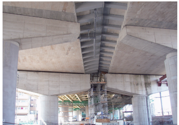
写真四 RC中空床版部中央分離帯側のFRP型枠

により剥落防止効果が期待できる。一方、新設するプレキャストPC床版ではポリプロピレン繊維をコンクリートに混入して将来の剥落防止対策を行った。JRとの交差状況を写真一、市道との交差状況を写真二に示す。