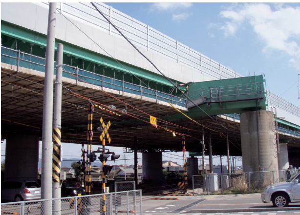
写真二 市道との交差状況