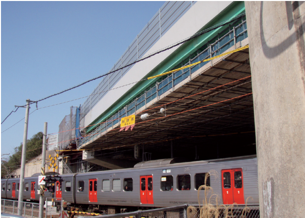
写真一 JRとの交差状況